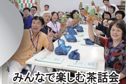
みんなで楽しむ茶話会