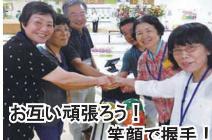
お互い頑張ろう! 笑顔で握手!