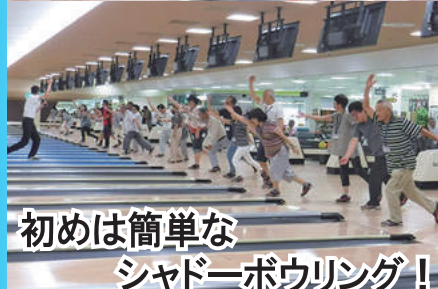
初めは簡単な シャドーボウリング!

公益社団法人 主催: 日本プロボウリング協会 後援: 富山県 後援: 富山市教育委員会