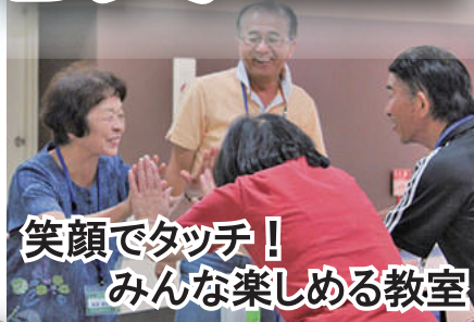
笑顔でタッチ! みんな楽しめる教室

公益社団法人 主催: 日本プロボウリング協会 後援: 富山県 後援: 富山市教育委員会