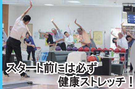
スタート前には必ず 健康ストレッチ!